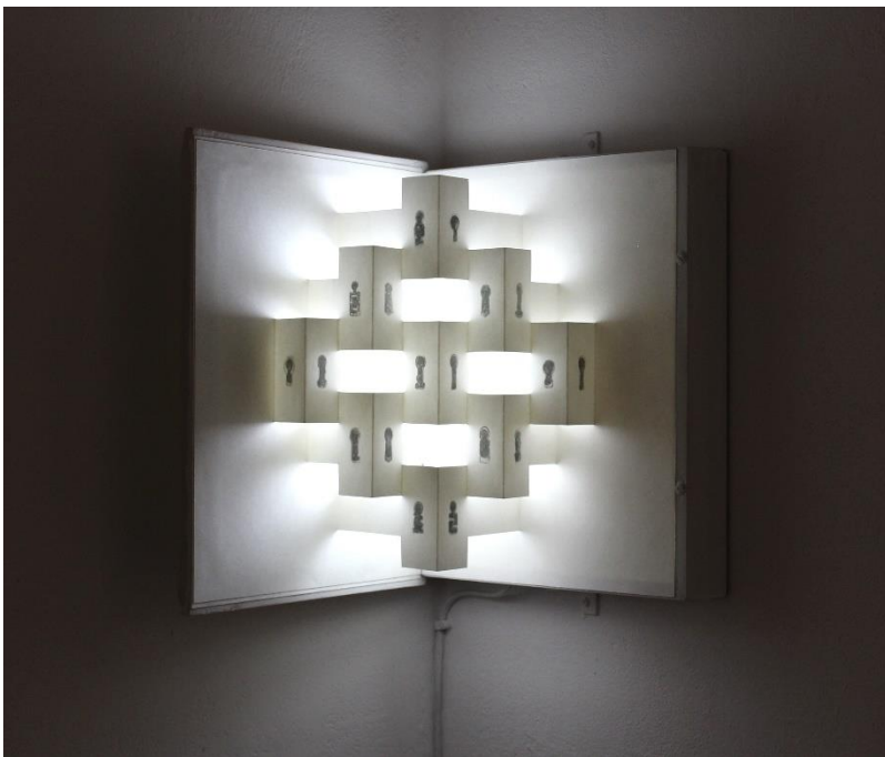
Lucie Martin-Granel, Pyramide miroir , 2018

Vernissage le vendredi 3 septembre à partir de 18h30 (sous réserve des mesures sanitaires)