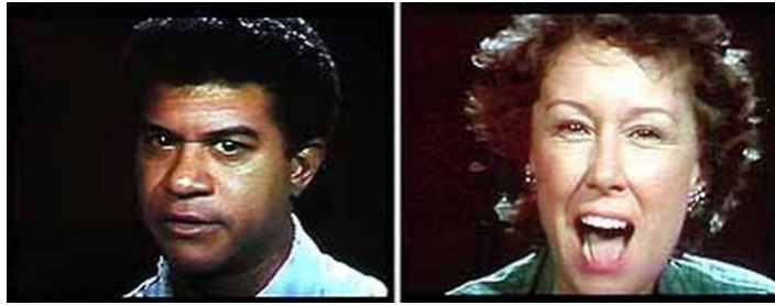
Bruce Nauman, Good Boy, Bad Boy , 1985

Michèle Magema, artiste née à Kinshasa (RDC), se filme dans The kiss of Narcisse vêtue d'une robe blanche, le visage partiellement peint en blanc, embrassant le moulage de plâtre blanc de son propre visage. Un moment poétique et mystérieux qui abolit la fatalité de la ségrégation par la couleur.