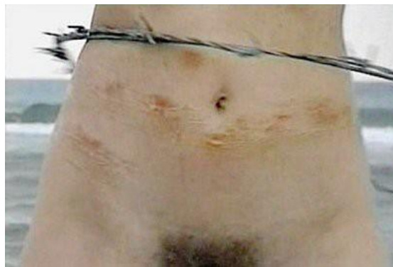
Sigalit Landau, Barbed Hula , 2001

Dans Good Boy, Bad Boy Bruce Nauman fait répéter une centaine de phrases à deux acteurs présentés côte à côte sur deux moniteurs. L'un est un homme noir à la chemise blanche, l'autre une femme blanche vêtue d'une robe verte. Le jeu de l'homme noir juxtaposé à celui de la femme blanche fait écho à des questions de différences de sexes et de races. L'exercice formel (les mêmes phrases sont répétées sur des tons différents et changent alors de sens) se double d'une réflexion sur les questions identitaires.