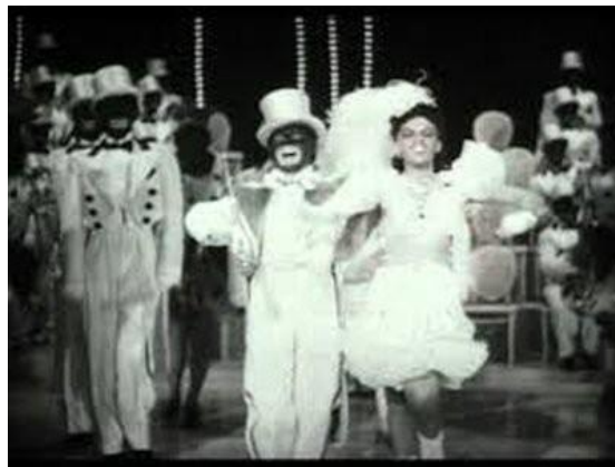
Busby Berkeley, Babes on Broadway , 1941