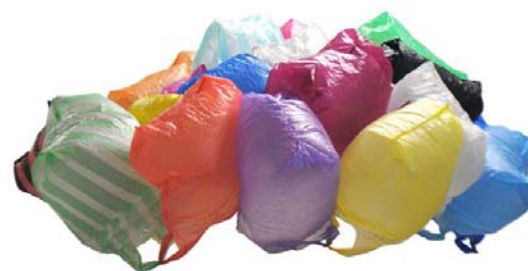
Florence Mirol- « On air » - 150 cm x 150 cm - Installation 2017

Exposition du 25 janvier au 10 février 2018