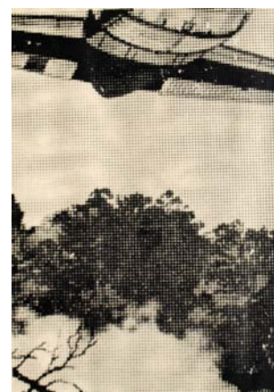
Florence Mirol- « L'avion, l'arbre » - 40 cm x 50 cm - Sérigraphie sur papier 2016 - 1/1